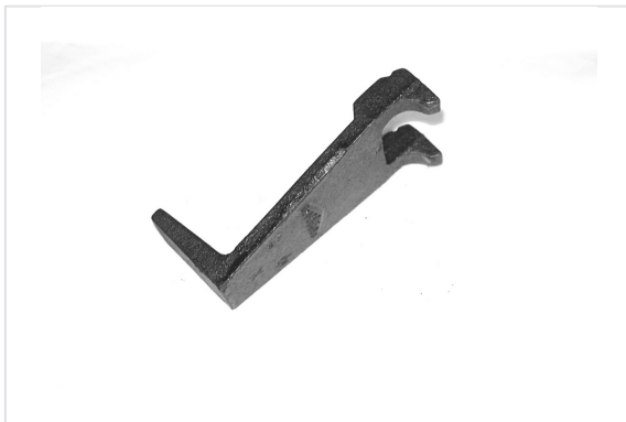
Diebstahlsicherungs-Keil für Deckel TEK / B-TEC