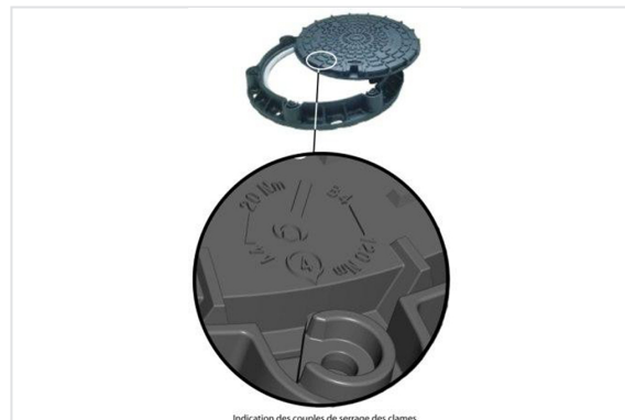
Angabe des Drehmoments