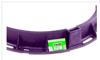
Schachtabdeckungen PAMREX 800 / VIATOP 800 mit Öffnungshilfe