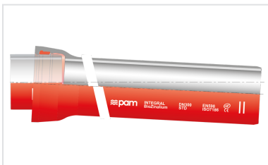
Kit Rohr Standard INTEGRAL + Standard Dichtung