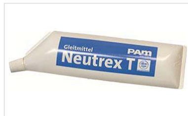
Gleitmittel NEUTREX T