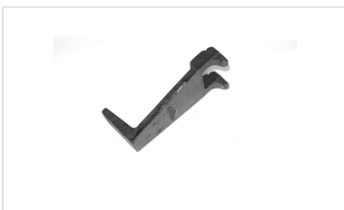
Diebstahlsicherungs-Keil für Deckel - Schachtabdeckungen TEK und B-TEC