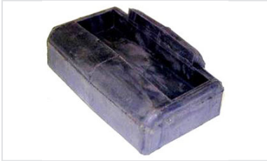
Stopfen für PAMREX 600 und 700