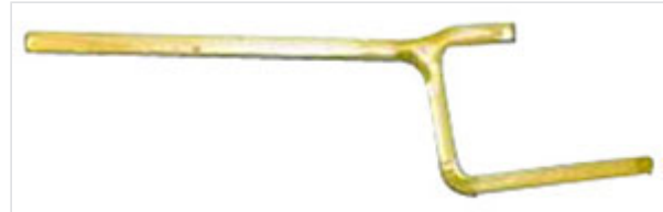
Montagehilfe für Halteringe aus Gusseisen