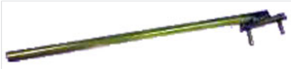
Spannhebel für Halteringe aus Gusseisen