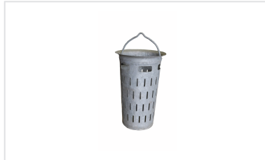
Schmutzeimze für Aufsatz SQUADRA und DEDRA 400