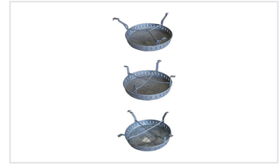
Schmutzfänger Schachtabdeckungen PAMREX