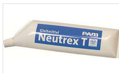
Gleitmittel NEUTREX T