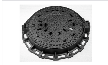
Anti-Diebstahl-Kit für Schachtabdeckungen PAMREX / VIATOP 600 und 700 / VIATOP 2