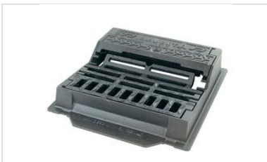
Aufsätze SELECTA 500 und MAXI C250 - Handhabung