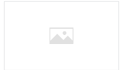
Schachtabdeckungen AKSESS und PARXESS Ergonomie - Handhabung