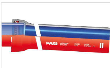
Kit Tubería Standard INTEGRAL Ductan + Junta Standard Vi