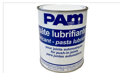
Pasta lubricante - Gamas CLASSIC, NATURAL, INTEGRAL, y PLUVIAL