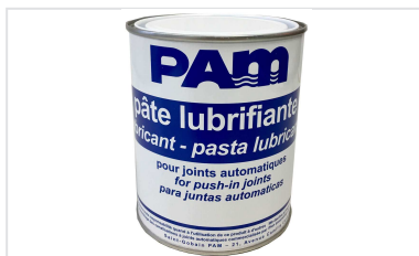
Pasta lubricante - Gamas CLASSIC, NATURAL, INTEGRAL, y PLUVIAL