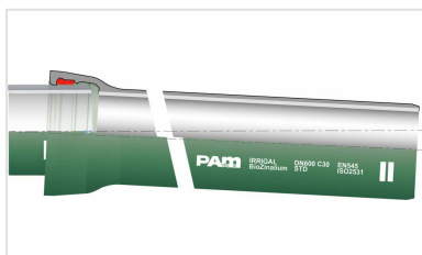
Kit Tubería Standard IRRIGAL + Junta Standard