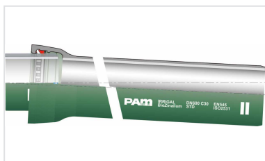
Kit Tubería Standard IRRIGAL + Junta Standard Vi