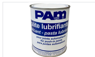
Pasta lubricante - Gamas CLASSIC, NATURAL, INTEGRAL, y PLUVIAL