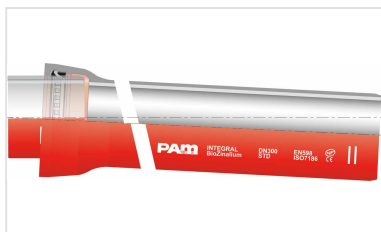
Kit Tubería Standard INTEGRAL + Junta Standard Vi