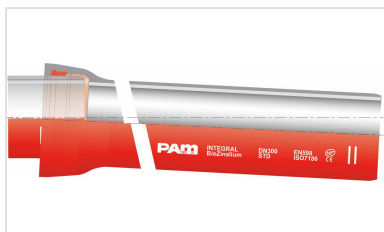
Kit Tubería Standard INTEGRAL + Junta Standard