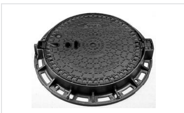
Registros PAMREX - Tapa articulada y cajera de maniobra ergonómica