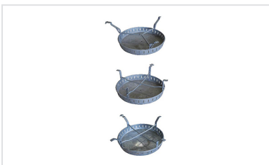
Cubo de lodos para Registros PAMREX