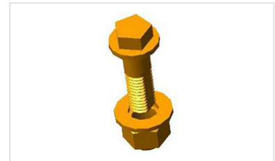
Acerrojados ¼ de vuelta