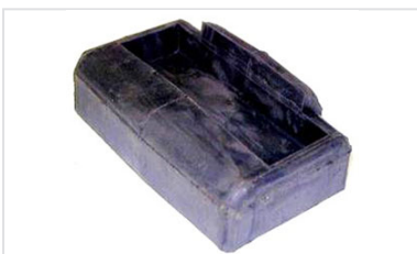
Tapones para PAMREX 600 y 700

(1) Para reducir aún más las entradas de agua de escorrentía, existe la posibilidad de montar en los registros PAMREX una junta secundaria de referencia C45.