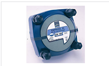
Kit Express Vi para Tubería y Accesorios Express DN300