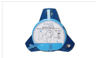
Kit Express New Vi para Tuberías y Accesorios Express DN60-250