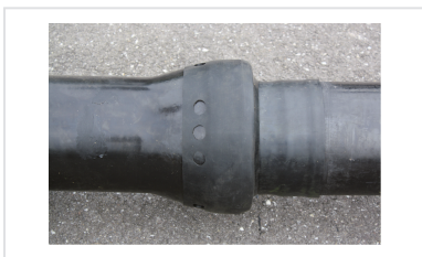
Manguito Standard TT EPDM - Protección para las juntas de las tuberías y de los accesorios DN60 a 300