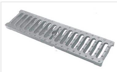
Rejillas para canaleta prefabricada 500x124 Clases C250, D400, E600