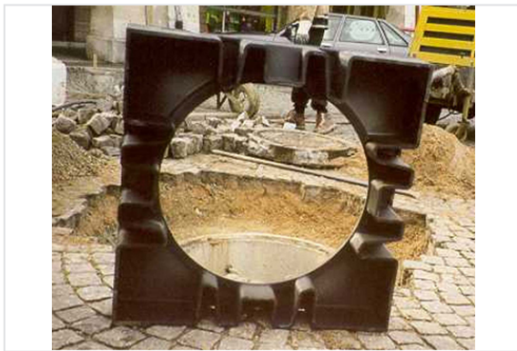
Ejemplo de instalación en pozos con tabiques de ladrillo