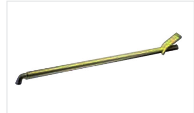
Accesorios para registros : Llave de maniobra C24 para PAMREX, VIATOP y VIATOP 2