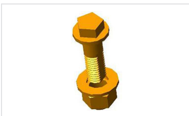
Acerrojados ¼ de vuelta