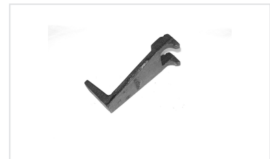
Dispositivo antirrobo para tapas - Registros TEK y B-TEC