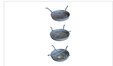
Cubo de lodos para Registros PAMREX