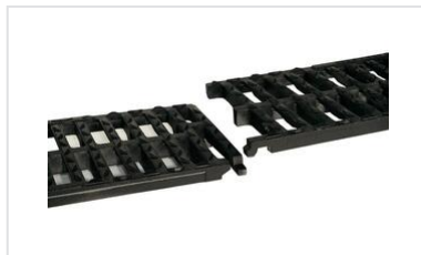
Rejilla AUTOLINEA C250 - Dimensiones de las canaletas de hormigón