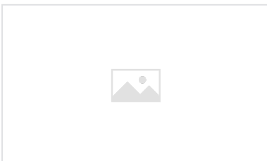
Rejillas AUTOLINEA - Montaje y desmontaje de las rejillas