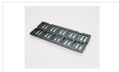
Rejilla MECALINEA C250 - Dimensiones de las canaletas de hormigón