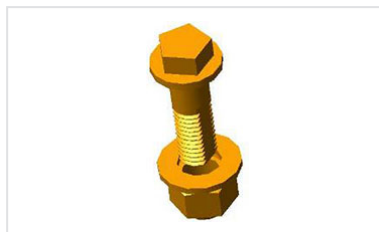
Acerrojados ¼ de vuelta