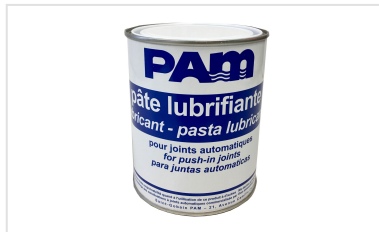
Pasta lubricante - Gamas NATURAL, INTEGRAL, y PLUVIAL