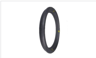
Bague de joint Standard Gravitaire (STD G) pour tuyaux et raccords BIOGAN® DN150-200