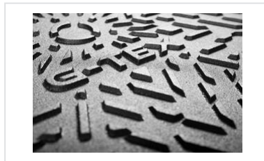
Info produit - G-TEX : un concept innovant d'ouverture/fermeture