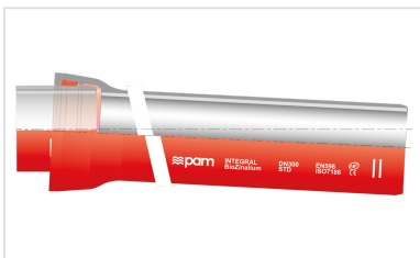
Ensemble Tuyau Standard INTEGRAL + Joint Standard