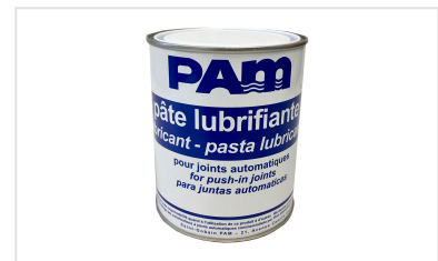
Pâte lubrifiante - Gammes NATURAL, INTEGRAL, et PLUVIAL