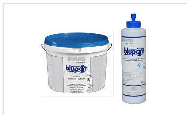
Pâte lubrifiante BLUPAM