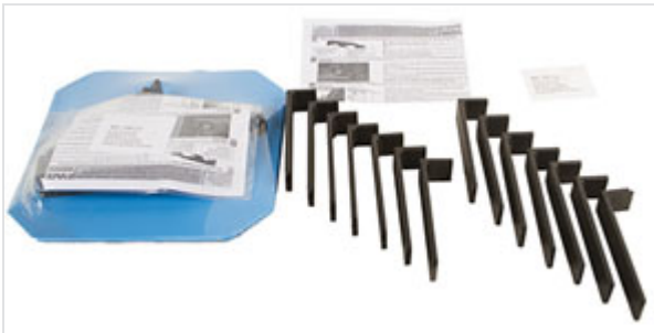
Kit de cales pour démontage jonction Universal Ve