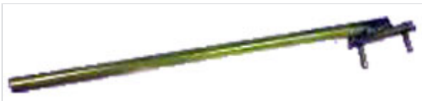
Levier de mise en place du jonc Universal Ve / Alpinal / Tis-K