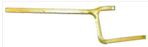
Cales de maintien à levier pour montage jonction Universal Ve / Alpinal / Tis-K