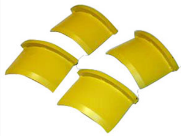
Kit de cales pour démontage jonction Universal Ve / Alpinal / Tis-K