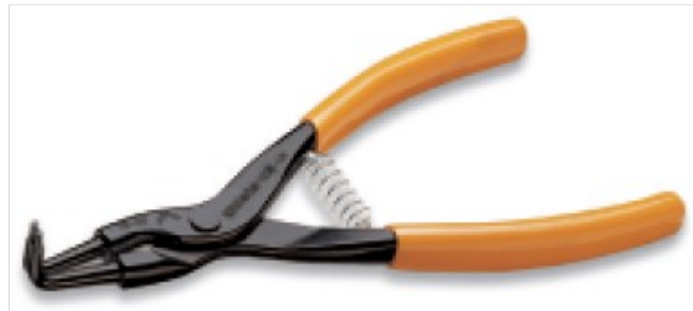
Pince de mise en place de la cale de maintien du jonc Universal Ve / Alpinal / Tis-K