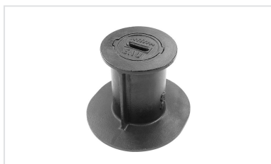
Notice de pose - Bouches à clé TOTALE