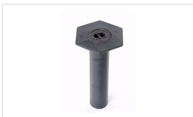
Bouche à Clé EXHAUSSABLE