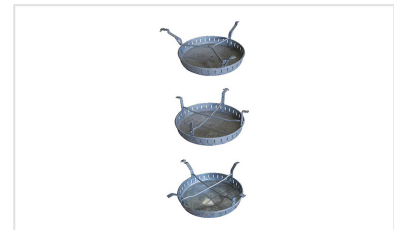
Seau à boue pour regards PAMREX