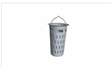
Seau à boue Grilles SQUADRA et DEDRA 400