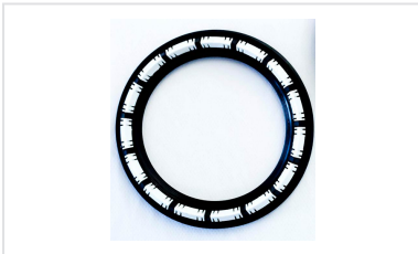
Bague de joint IZIFIT