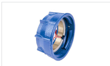
Contrebride de verrouillage IZIFIT-K