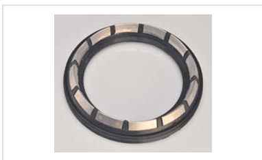
Bague de joint IZIFIT Vi