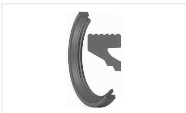
Bague de joint IM pour raccords gravitaires