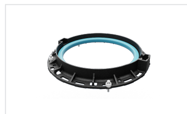
Solution de scellement rapide et durable INSTALL Plus pour PAMREX