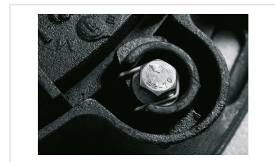
Info produit - Regards PAMETANCHE - Clips anti rotation - Mise en oeuvre