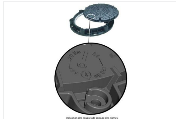
Indication des couples de serrage des clames