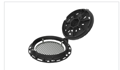
Grilles antichute articulées pour PAMREX 600