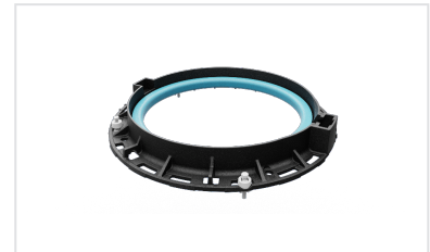
Solution de scellement rapide et durable INSTALL Plus pour PAMREX