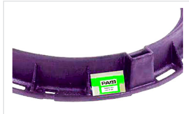
Regards PAMREX 800 et VIATOP 800 avec vérin d'assistance