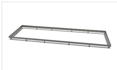
Préconisations d'installation pour cadres TELECOM T-MAX-i C250