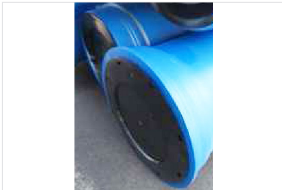
Bouchons polyéthylène DN350-600