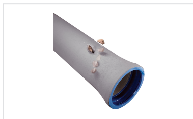
Notice de pose - Coupe ZMU